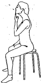
Isolierte Retraktion des Kopfes