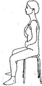
Thorax senken und